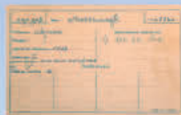
Doc 16, Mohammad Mossadegh, sa requête de l'avis. Bibliothèque de la ville de Neuchâtel

Il entreprend donc, fin juin 1913, une procédure de naturalisation qui se poursuit sans difficulté jusqu'au préavis négatif de la Commission des agrégations de la commune de Neuchâtel, qui constate que si Mossadegh veut devenir avocat, ce n'est pas dans l'intention de s'établir à Neuchâtel. En ayant été informé, il retire sa requête le 4 juillet 1914 et repart pour la Perse.