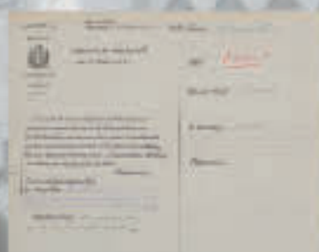
Approbation des professeurs, 27 août 1913