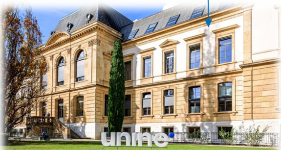
Bâtiment 09, Av. du 1er-Mars 26 : Examen final du 23 juillet