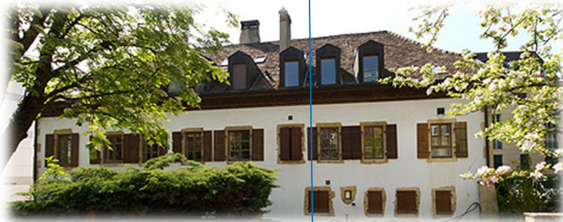
Bâtiment 04, Fbg de l'Hôpital 61-63 : Laboratoire Multimédia LMM