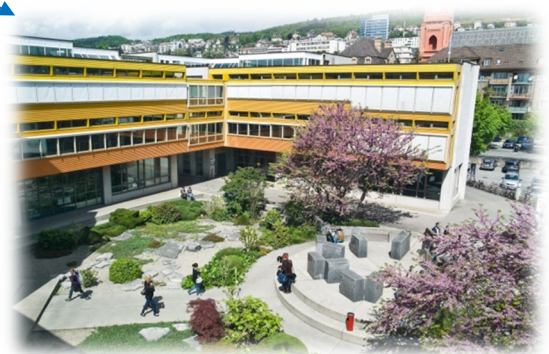
Bâtiment 01, Espace Tilo-Frey 1 : Cours d'été