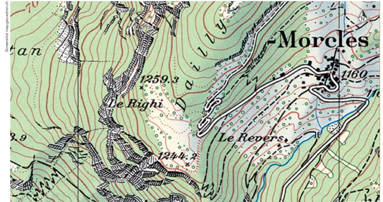
Bild 2: Ausschnitt der Schweizerischen Landkarte 1991: Die oberirdischen Gebäude der Festung Dailly nahe von Saint-Maurice (VS) fehlen