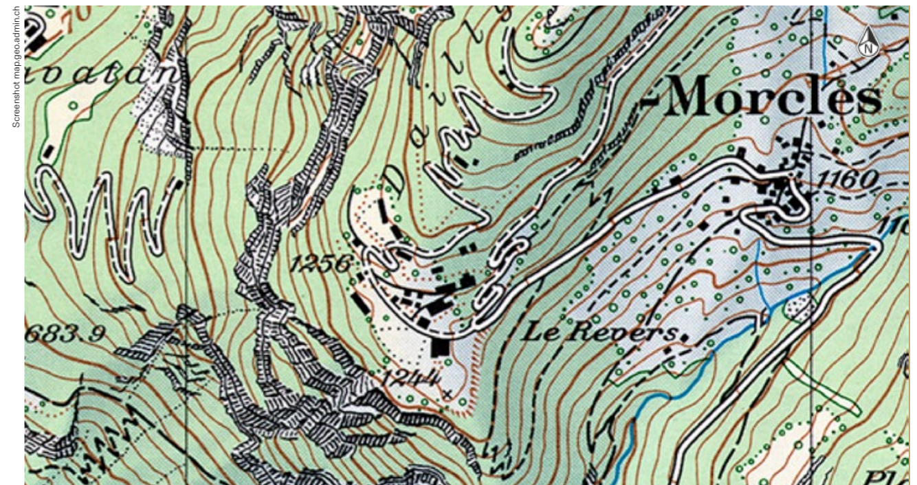
Bild 3: Ausschnitt der Schweizerischen Landkarte 1992: Die oberirdischen Gebäude der Festung Dailly nahe von Saint-Maurice (VS) sind nun sichtbar

Strategie des Untergrundes geheim zu halten nicht immer schon ambivalent und letztlich zum Scheitern verurteilt? Schliesslich sind auch diese geheimen Welten seit jeher eng mit der Gesellschaft verknüpft (allein schon in ihrer Materialität, als Produkt tausender Arbeitsstunden und hochspezialisierter ExpertInnen und Geräte). In diesem Beitrag gehe ich den Ambivalenzen der