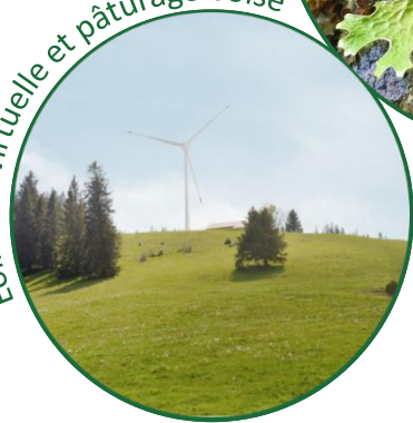
Eolienne virtuelle et pâturage boisé