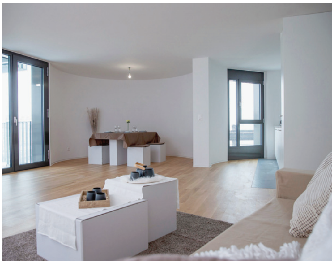
Les acheteurs qui ont dû se rétracter en raison du Covid-19 sont restés rares.

Nous n'avons pas observé de changements significatifs. Les conditions, notamment les taux, restent attrayantes. Le Salon de l'immobilier neuchâ-