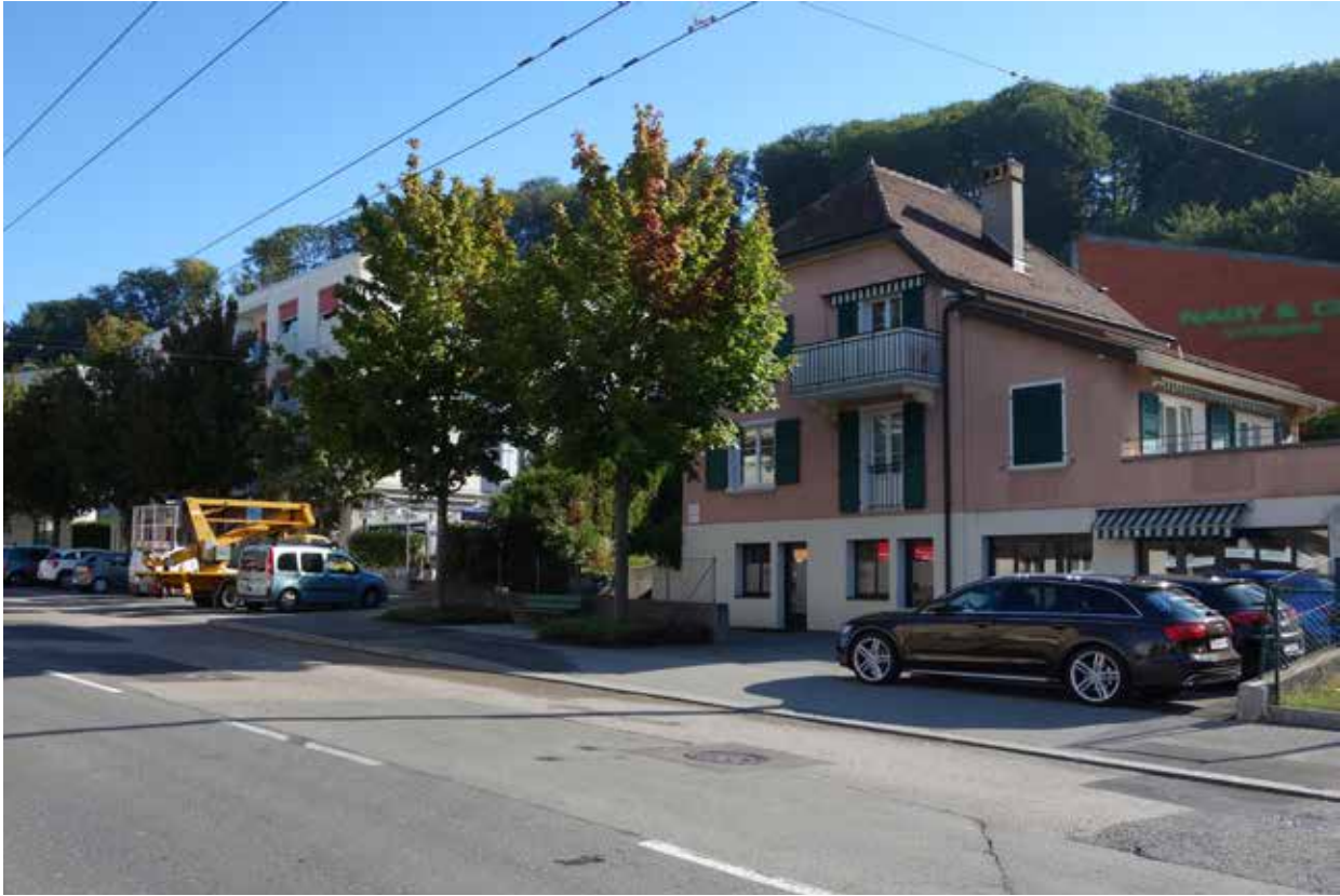
Maisons individuelles et immeubles à proximité de la forêt de Sauvabelin.

d'anciennes maisons où résident les Suisses non issus de la migration et également des résident-e-s étrangers, pour la plupart européens anciennement établis. Au sein de ces groupes, certain-e-s tiennent à se distinguer de la partie « populaire » de Bellevaux qui correspondrait notamment à Entre-Bois.