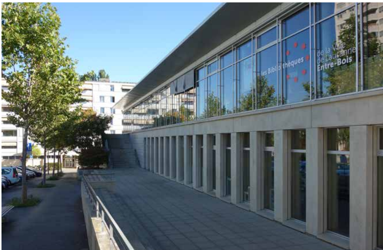
Centre de quartier abritant différents services de la commune: Bibliothèque, APMS, Centre socioculturel et Forum de Quartier.

D'une part, les habitats situés du côté de la forêt de Sauvabelin se caractérisent notamment par une présence importante