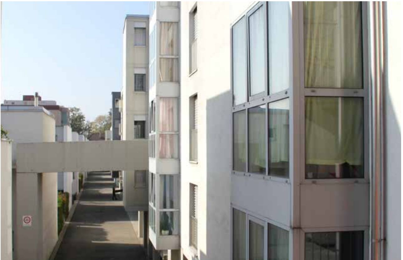
Passage entre les immeubles des Jardins de Prélaz.