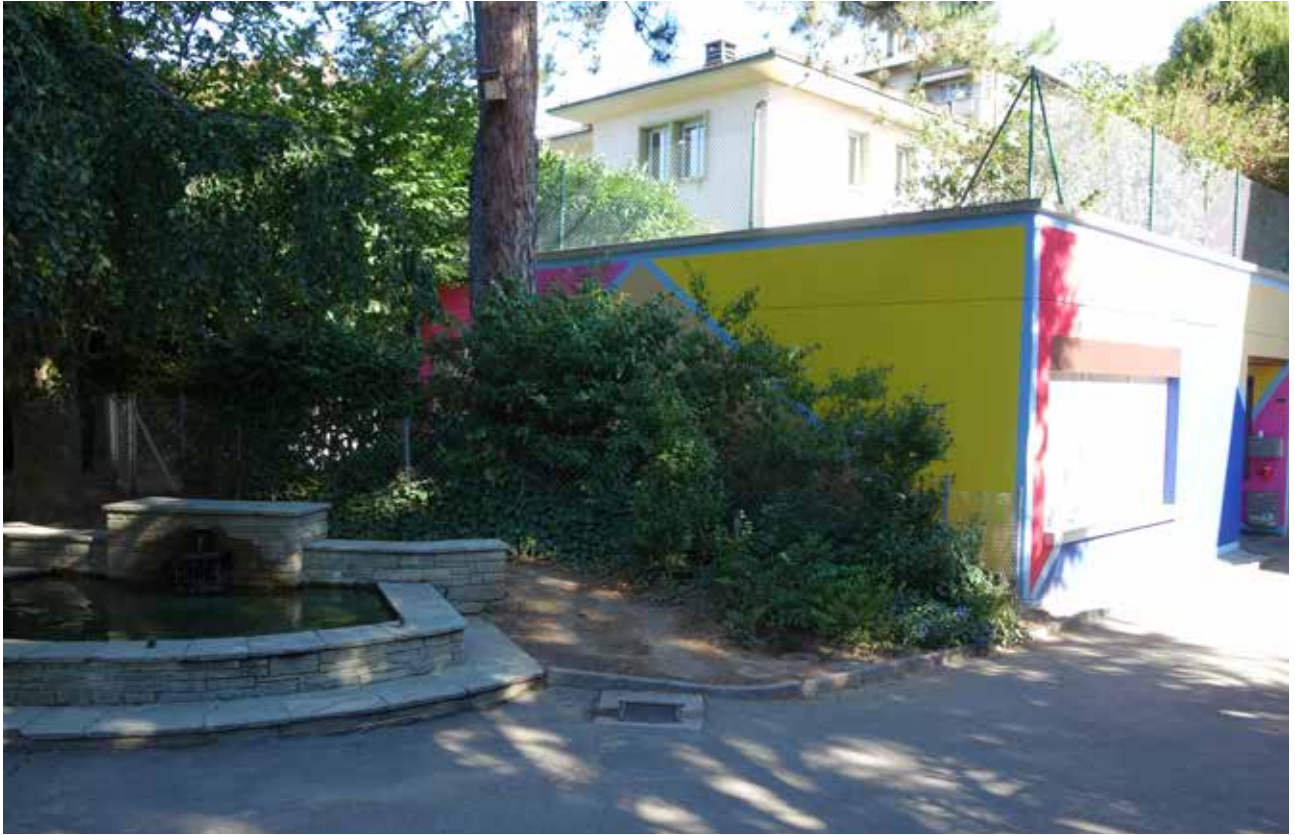
Le Centre socioculturel de Prélaz-Valency.