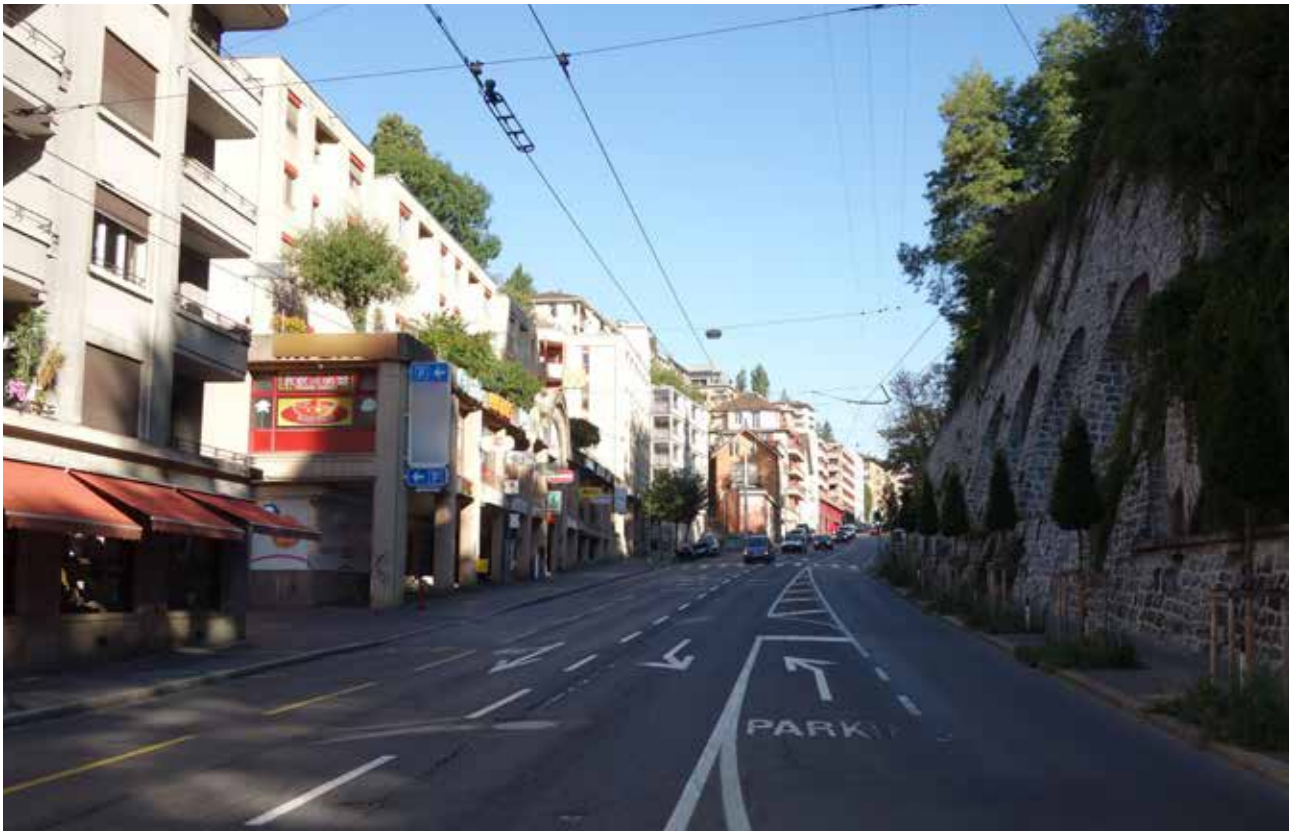
Le bas de la rue de la Borde vu depuis la place du Tunnel.

tonnoir de Bellevaux en passant par la route Aloys Fauquez, séparant le quartier en deux entités parallèles. De l'avis des habitant-e-s, cette traversée accentue davantage la fragmentation du quartier et rend impossible les interactions sociales de part et d'autre de la route. Le passage continu des voitures est perçu comme une source d'insécurité pour les jeunes de la Permanence Jeunes Borde (PJB; cf. encadré ci-dessous). La Borde concentre un important parc de logements subventionnés appartenant à la Ville et destiné notamment aux familles nombreuses et à des personnes en situation de précarité et/ou d'insécurité sociale. La concentration des structures d'aide à la population telles que le Groupe d'accueil et d'action psychiatrique (Graap) et Caritas, pourrait être par ailleurs un indicateur du faible niveau du pouvoir d'achat de la plupart des résident-e-s et de leur situation sociale.