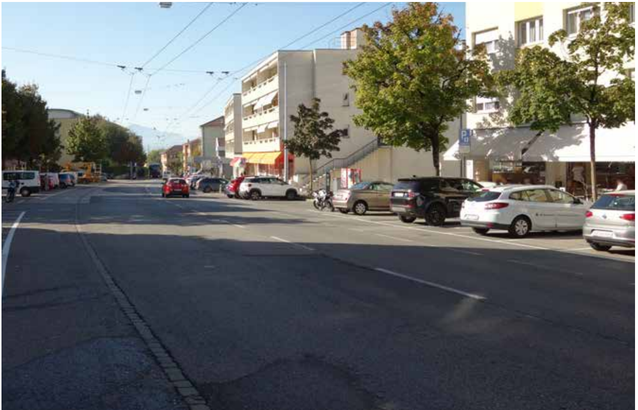
La route Aloys-Fauquez, qui traverse le quartier de Bellevaux.

Pour favoriser une approche globale du vivre-ensemble soucieuse de prendre en compte les spécificités des quartiers, il semble judicieux de considérer les formes concrètes de collaborations possibles et les limites liées au développement du quartier. Pour connaître les besoins spécifiques et les faire remonter, les professionnel-le-s de terrain, et notamment l'animation socioculturelle, peuvent jouer un rôle primordial dans ce contexte. Le travail de proximité de ces professionnel-le-s, familiers du quartier et de ses habitant-e-s, est susceptible de faire émerger et d'accompagner des initiatives qui verraient difficilement le jour autrement.