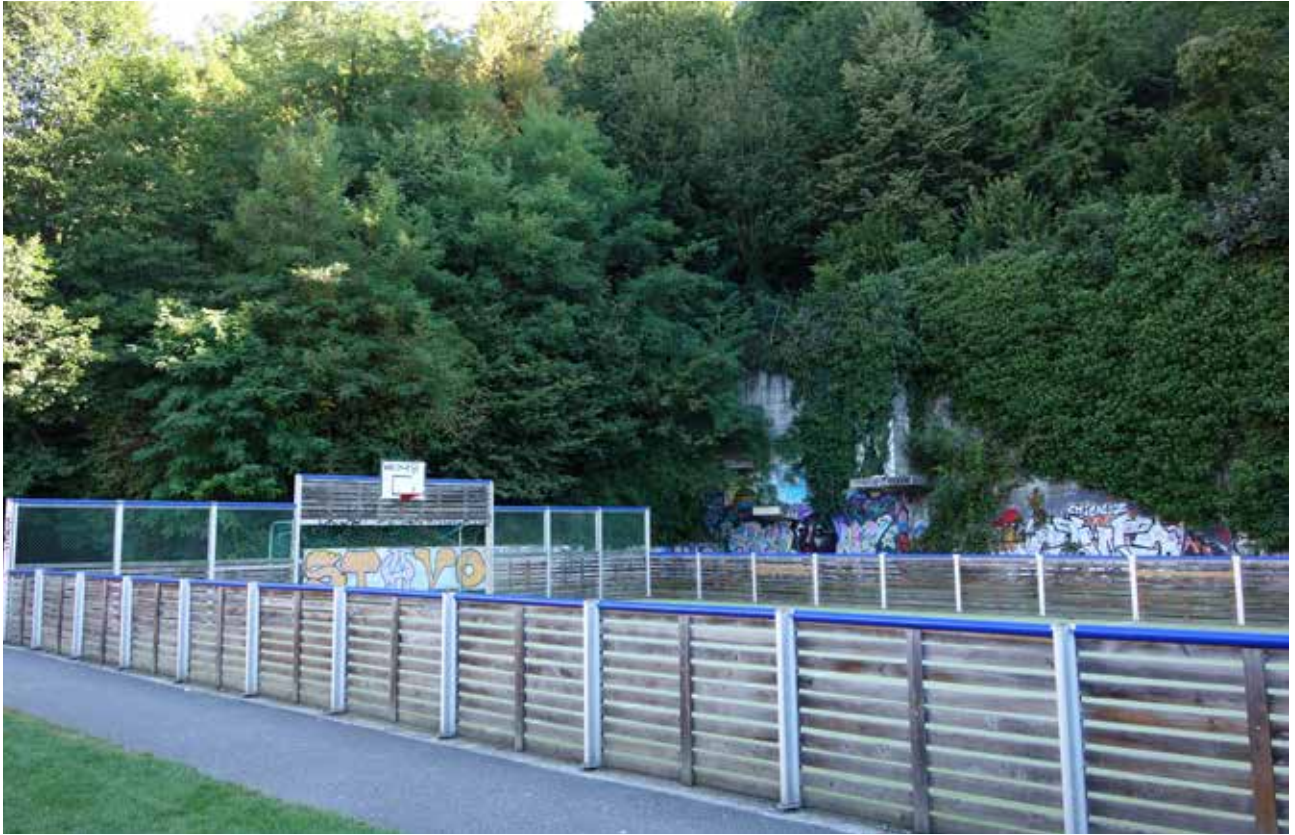
Le terrain de Près-des-Druides, derrière des immeubles.

la nécessité de « prouver » que la Borde, grâce aux talents de ses habitant·e·s et les initiatives collectives des associations, peut « modifier le regard négatif » porté sur le quartier. L'une des stratégies récurrentes données en exemple serait la « reconquête du peu d'espace public » (reconquérir les places de détente, de loisirs, espaces verts) par les résident·e·s avec le soutien des autorités communales. Les habitant·e·s (adultes) se disent capables de prendre leur destin en main et de changer la mauvaise réputation de la Borde, si les autorités leur donnent une telle opportunité en soutenant financièrement les initiatives des associations et leurs projets de développement du quartier.