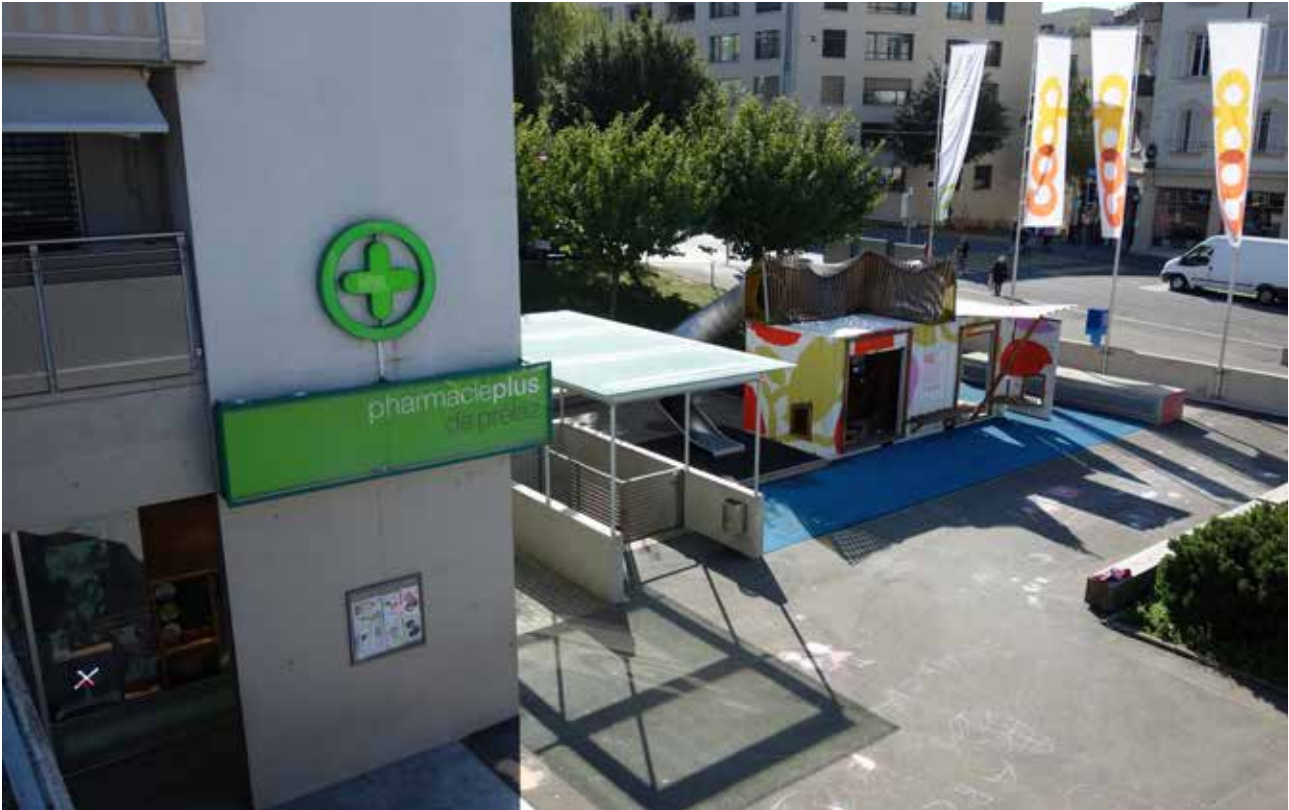
La place devant les commerces des Jardins de Prélaz.