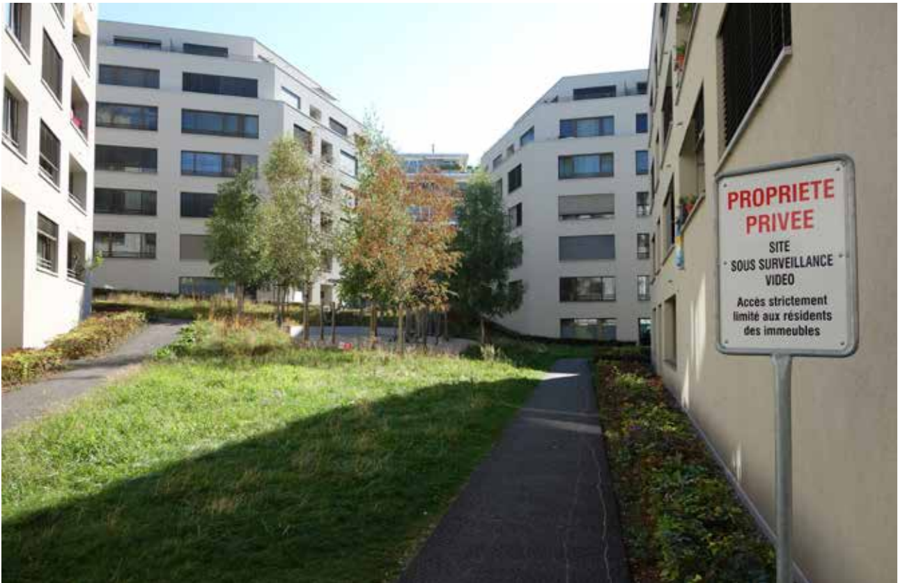
Les immeubles en PPE de la Cité de Prélaz.