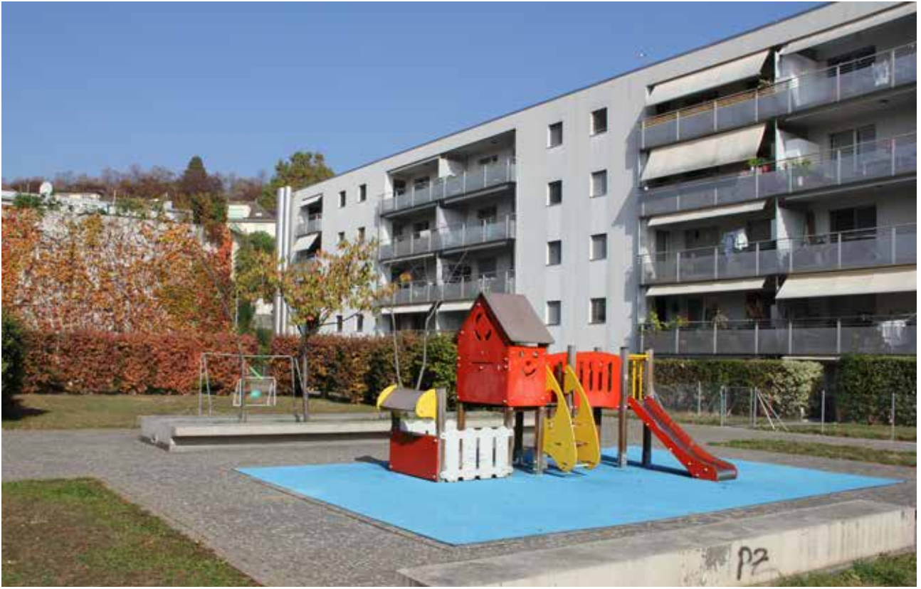
Les Jardins de Prélaz.