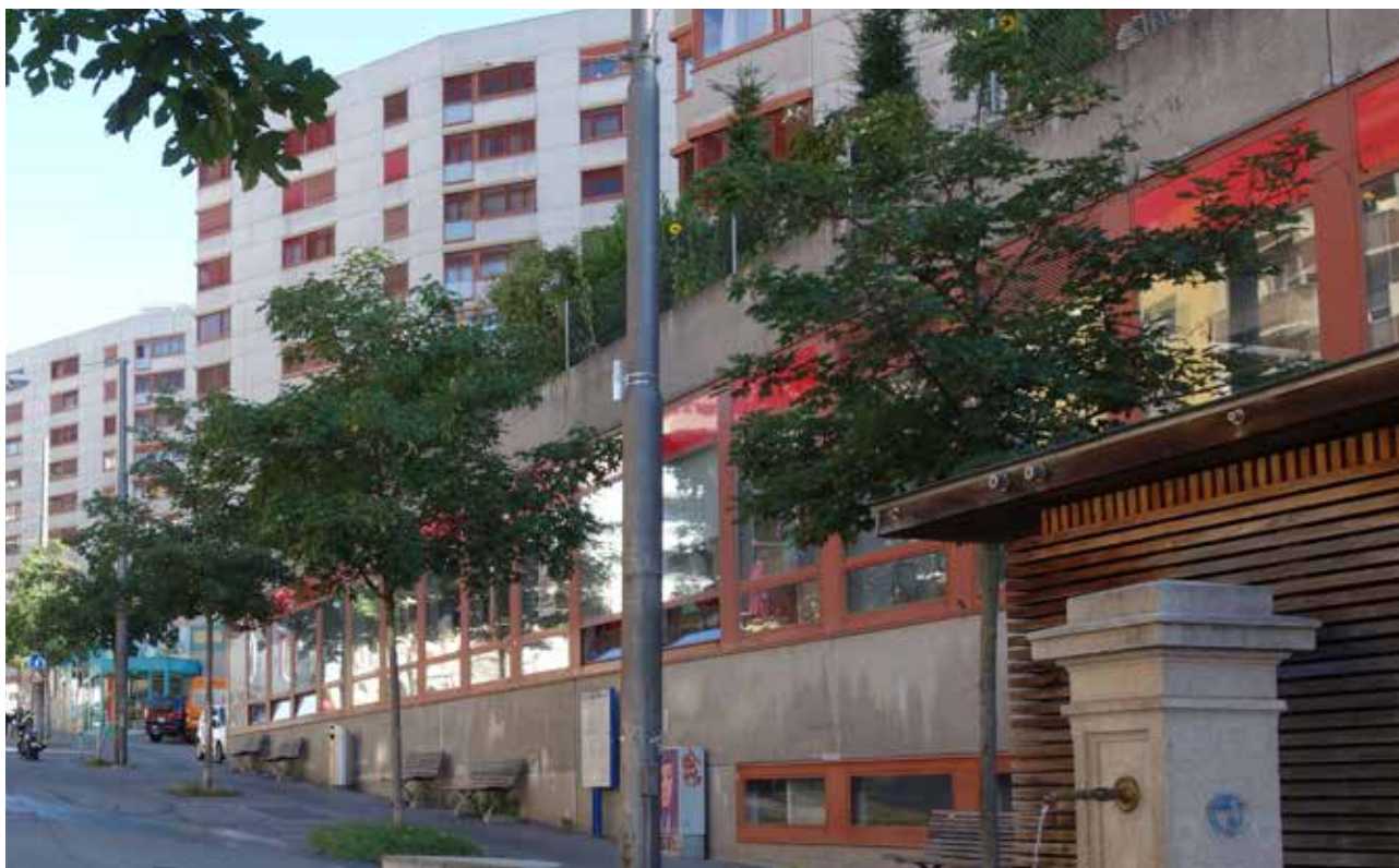
Place publique devant l'Armée du Salut.

Comment le vivre-ensemble, au-delà des contraintes existantes – cohabitation de personnes de diverses cultures d'origine (d'Afrique du Nord, subsaharienne, des Balkans, etc.) –, est-il toutefois promu à la Borde? Le focus group regroupant certain-e-s responsables des associations de migrant-e-s montre que les points de vue divergent sur la dynamique collective autour des activités pensées de manière concertée. Ceci s'explique par le fait que la Borde comprend plusieurs associations. Le grand défi reste alors les différences de visions en termes d'activités à mettre en œuvre ou à soutenir prioritairement. Toutefois, les points de vue convergent sur