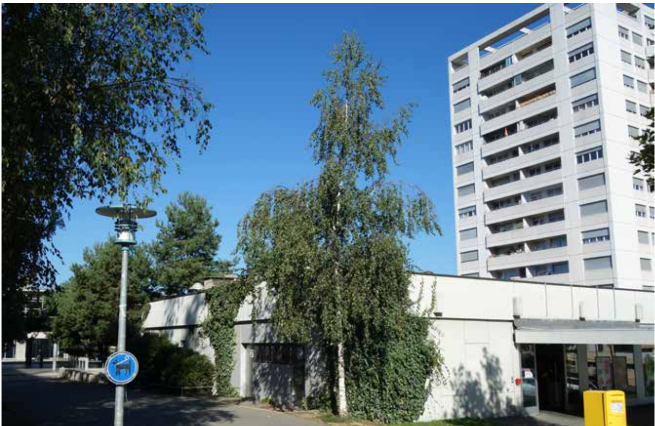
Immeuble et centre commercial au chemin d'Entre-Bois.

personnes adultes originaires par exemple de la Turquie, du Kosovo, de la Serbie, des pays du Maghreb qui se côtoient certes, mais ne se mélangent pas, alors même que leurs enfants jouent ensemble. D'ailleurs, selon un des professionnel-le-s rencontrés, l'approche participative dans le cas spécifique de Bellevaux peut poser problème puisqu'il s'agit de mettre ensemble des publics « diamétralement » opposés et qui ne se fréquentent normalement pas: