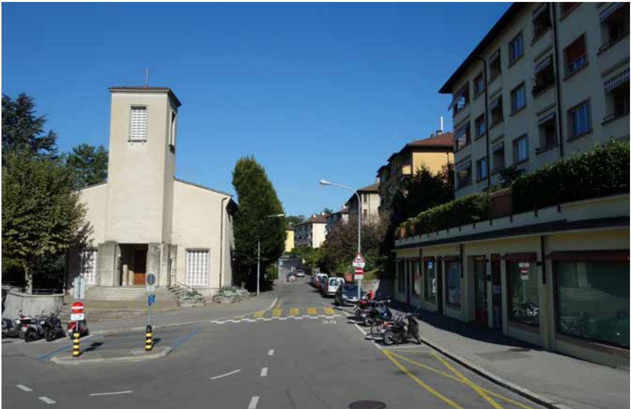
L'église et la mosquée (à droite) de Prélaz-Valency.

Quant aux nuisances sonores, les personnes rencontrées pensent qu'elles deviennent un « vrai problème » pour l'ordre public. Nous avons pu observer plusieurs interactions entre un effectif important d'adolescent-e-s ayant rejoint les activités de la FASL à la place de jeux, lors des vacances scolaires 2018. De fait, leur arrivée devant le centre socioculturel Prélaz-Valency où se déroulaient les activités et où se trouvaient également parents et enfants, ne passait pas inaperçue. Au contraire, elle crispait les regards et concentre l'attention des adultes pour une courte période. L'objet de ce changement provisoire d'ambiance était essentiellement la nuisance sonore des motos conduites à vive allure sur un espace restreint rempli de jeunes enfants, l'utilisation de langage inapproprié ainsi que des provocations mutuelles. Toutefois, nous avons pu noter que l'intervention des professionnel-le-s de terrain permet de ramener le « calme et l'ambiance » de départ.