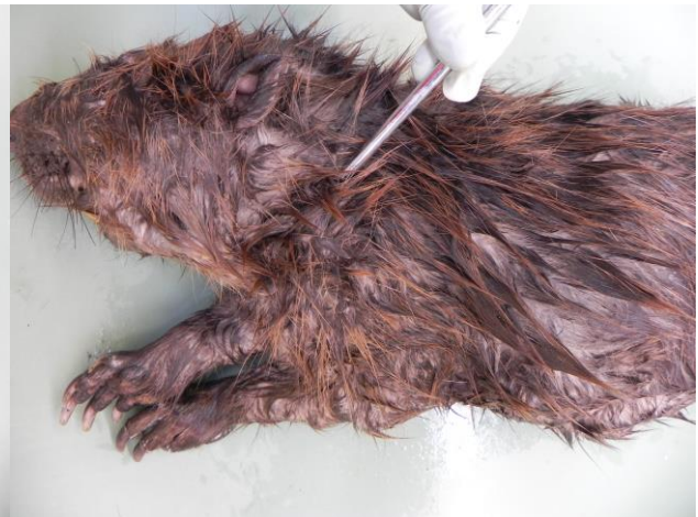
Abb. 4: Position, wo der Chip gesetzt wird von der Seite: linker Schulterbereich.