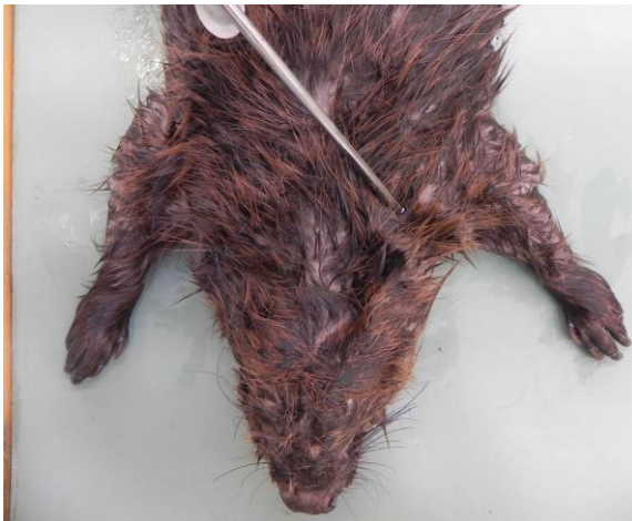
Abb. 3: Position, wo der Chip gesetzt wird von oben: linker Schulterbereich.