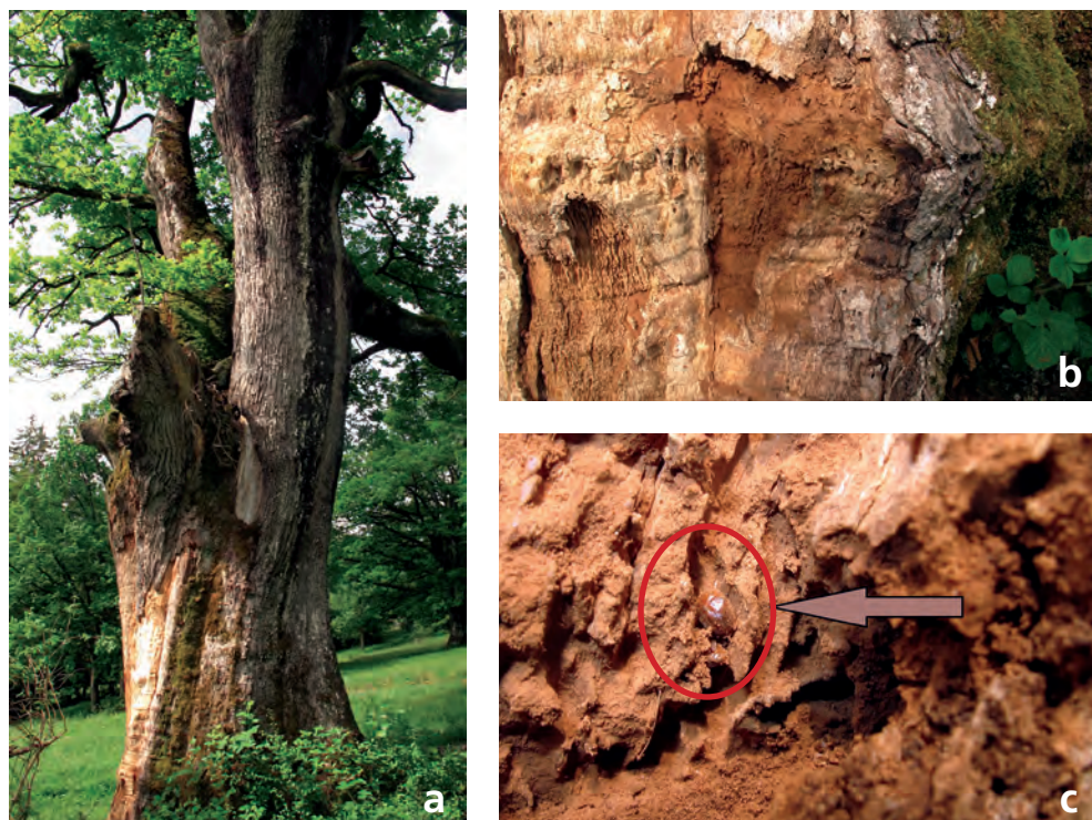
Fig. 4. a) Chêne centenaire où a été découvert Anitys rubens à Orvin (BE). L'espèce colonisait la surface ensoleillée dépourvue d'écorce située à la base du tronc, b) agrandissement de la zone favorable, c) gros plan sur le milieu colonisé: un individu est visible au centre de l'image. (Photos Y. Chittaro)

même habitat, troué de galeries larvaires, alors que plusieurs Mycetophagus piceus (Fabricius, 1777) (Mycetophagidae) se trouvaient à quelques centimètres de distance. Les autres parties du tronc ne présentaient pas ce degré de décomposition très particulier, correspondant aux indications de la littérature (Möller & Schneider 1992), et aucun autre Anitys rubens n'a été trouvé lors des quelques pointages effectués.