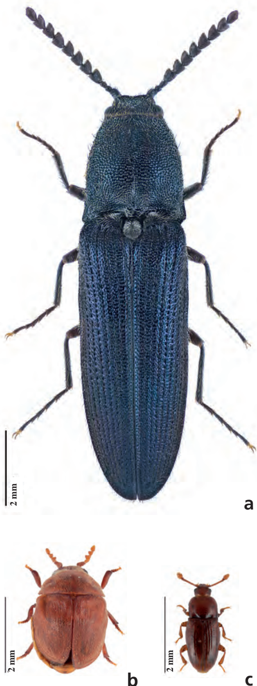
Fig. 2. Habitus de a) Limoniscus violaceus (individu d'Angleterre), b) Anitys rubens et c) Philothermus evanescens .

Au cours d'une prospection au-dessus du village de Fully, un chêne d'environ 60 cm de diamètre présentant une cavité haute et une cavité basse a été repéré (Figs 3a, b). Si la cavité haute était dépourvue de terreau (tronc creux), la cavité basse, accessible depuis le sol grâce à la légère inclinaison du tronc, en était remplie. Rapidement, un élytre violacé a été découvert et a immédiatement fait penser à L. violaceus . Une partie du terreau a donc été récoltée, ramenée au domicile du premier auteur puis soigneusement tamisée, avant d'être remise quelques jours plus tard dans la cavité. Ce tamisage a permis la découverte de restes supplémentaires de L. violaceus , confirmant la détermination supposée. Trois élytres gauches, deux élytres droits et surtout deux pronota caractéristiques (Fig. 3c) ont ainsi été mis en évidence, indiquant la présence d'au moins trois individus différents. Plus intéressant encore, une jeune larve a également été trouvée, attestant de la présence toujours