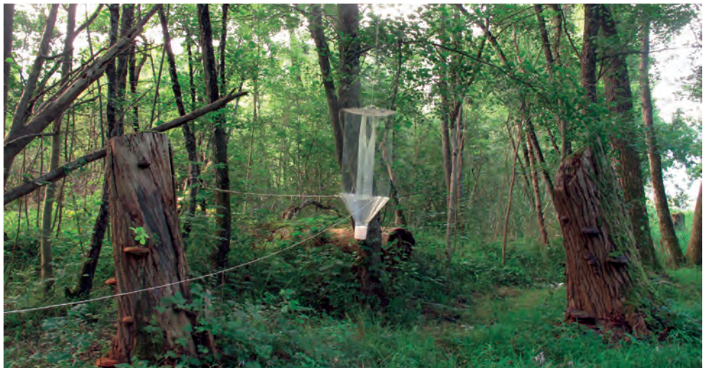
Fig. 1. Piège d'interception ayant permis la capture du spécimen de Philothermus evanescens à Noville.

Les auteurs ont continué à pratiquer en 2017 les méthodes de terrain qu'ils ont déjà utilisées abondamment par le passé. Ainsi, des pièges d'interception (Fig. 1) et des pièges attractifs aériens ont été placés dans de nombreux sites de Suisse. On se référera respectivement à Sanchez et al. (2015) et à Chittaro et al. (2013) pour de plus amples précisions concernant ces méthodes d'échantillonnages. Des recherches actives (chasse à vue, battage, fauchage, tamisage) ont également été menées ponctuellement en fonction des situations rencontrées.