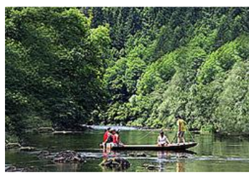
Promeneurs sur le Doubs