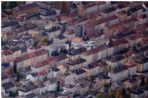
Vue aérienne de La Chaux-de-Fonds

L'Institut de géographie et le Groupe de recherche en économie territoriale, en partenariat avec l'Université de Franche-Comté, ont démarré un projet de recherche intitulé « La mobilité résidentielle transfrontalière et le fonctionnement du marché immobilier dans le département du Doubs et le canton de Neuchâtel ». Un projet qui permettra d'aborder la problématique du développement transfrontalier sous l'angle original des migrations et du marché immobilier.