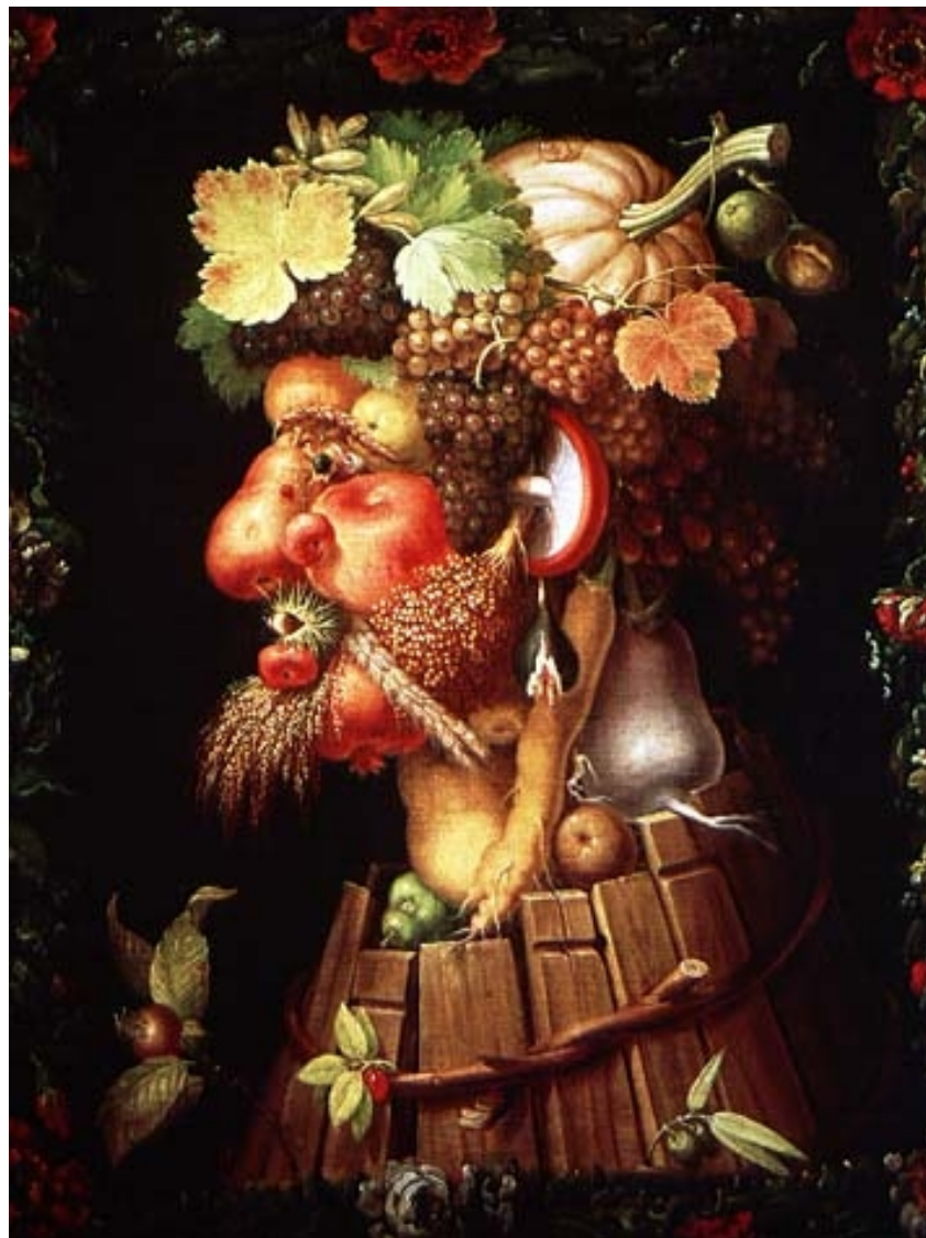
Arcimboldo, L'automne, 1573, Musée du Louvre