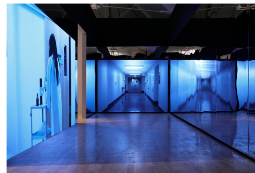
Image : The Infinity Engine , 2014, multimedia installation, partly interactive (genetically modified fishes, fish tank, screens, projections, wall paper, 3-D printed nose, files, electrics, and other materials), 380 x 1280 x 550 cm, installation view, Lynn Hershman Leeson. Civic Radar, ZKM | Museum of Contemporary Art, Karlsruhe, 2014/2015.