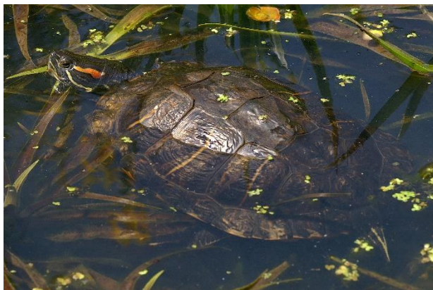
(gauche) Tortue de Floride ou Tortue à tempes rouges et (droite) Tortue à tempes jaunes ( Trachemys scripta )