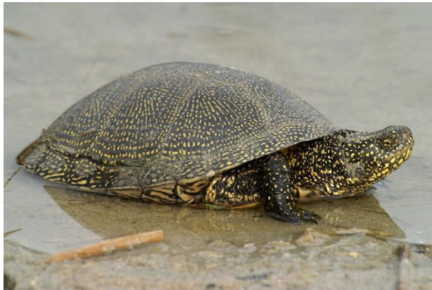
Cistude d'Europe ( Emys orbicularis )

→ Auffang- und Pflegestation für Schildkröten im Thurgau Hermann Koller Untere Grenzstrasse 5, 8580 Amriswil (TG) 071 411 64 68 hermann_koller@hotmail.com