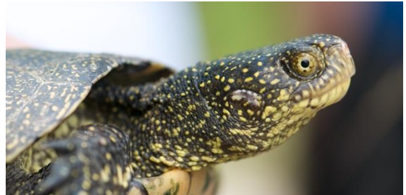
Cistude d'Europe ( Emys orbicularis )

Il n'existe en Suisse qu'une seule espèce indigène de tortue, la Cistude d'Europe, pour laquelle la répartition historique en Suisse reste imprécise. Actuellement, des populations sont présentes et se reproduisent régulièrement dans le canton de Genève et dans la région des Trois-lacs entre Marin, le Landeron et Kerzers.