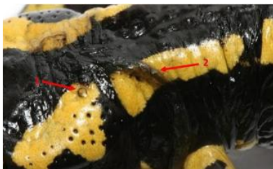
Ulcères cutanés et accumulations de peau « morte »