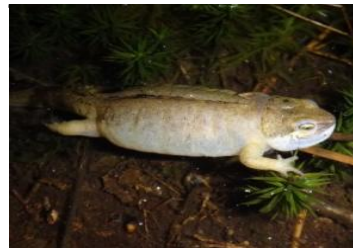
Gonflements des membres