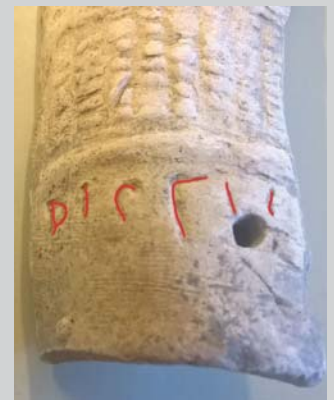
Fragments avec la mention de «Pistillus», signature connue à Autun