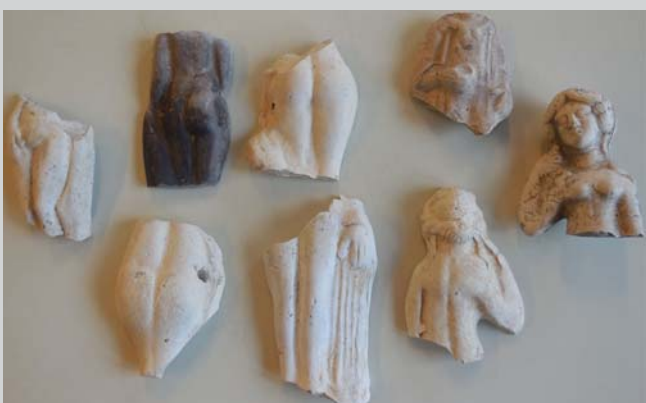
Fragments de Vénus

Une répartition hétérogène entre les différents secteurs publics, privés et/ou les différentes pièces d'une domus en fonction des groupes typologiques (animaux, hommes, Vénus...) et identification d'une origine locale ou étrangère, voire les deux.