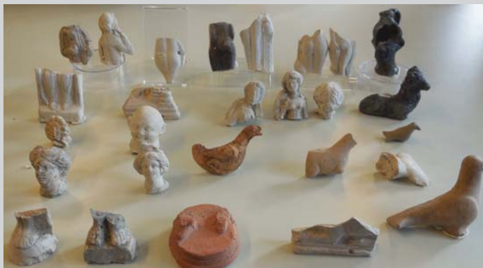
Fragments de statuettes avec des animaux, des têtes, des parties de corps