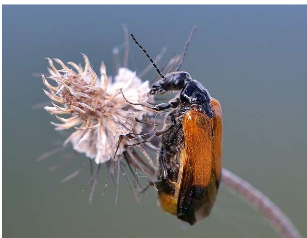
Abb. 1: Der Seidenbienen Ölkäfer Stenoria analis

Zeitverzögert mit der Ausbreitung ihres (Haupt?)-Wirtes, der Efeu-Seidenbiene wurde eine Ausbreitung des mit ihr verbundenen Seidenbienen-Ölkäfers ( Stenoria analis SCHAUM, 1859) (Abb. 1) prognostiziert, bei der wir eine südwest- und eine osteuropäische Population unterscheiden müssen. Nach den vorliegenden Daten hat die südwesteuropäische Population ihr Areal deutlich erweitert und ist nun zum einen deutlich häufiger in Ländern zu finden, in denen sie ehemals schon vorkam (Frankreich, Italien, evtl. auch schon Spanien). Weiterhin besiedelt sie inzwischen Länder, aus denen Nachweise bisher fehlten (Schweiz, Belgien, Niederlande). Und schließlich kommt sie mit Deutschland in einem Land vor, in dem die Art bisher lediglich vereinzelt aus dem Osten bekannt war, dass es jetzt aber von Südwesten her erneut besiedelt. Die Erstnachweise für Westdeutschland gelangen 2013 in Baden-Württemberg und in Rheinland-Pfalz (NIEHUIS & LÜCKMANN 2013).