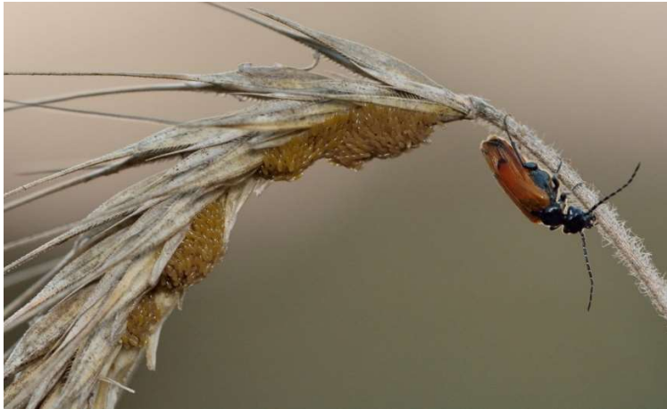
Abb. 2: Eiablage des Seidenbienen Ölkäfers.

Die Aktivitätszeit der Imagines erstreckt sich von ca. Anfang August bis Anfang/Mitte September. Zu dieser Zeit ist der Käfer auf krautigen oder trockenen Pflanzen zu finden, an denen auch die Eiablage stattfindet (Abb. 2). Bei höheren Temperaturen kann er auch schwärmend beobachtet werden.