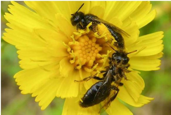
Abb. 4: Mit Triungulinen von Stenoria analis SCHAUM, 1859 besetzte Zottelbienen ( Panurgus sp.).

Weitere Informationen zu St. analis und C. hederæ mit beeindruckenden Fotos finden sich unter: https://www.flickr.com/photos/nico_bees_wasps/albums/72157607463849348 sowie http://gnorimus.blogspot.de/2015/09/stenoria.html .