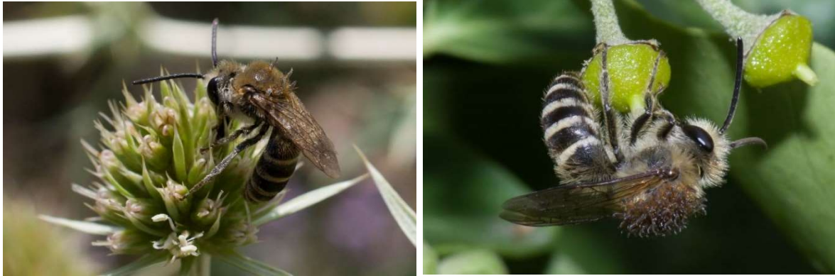
Abb. 3: Mit Triungulinen von Stenoria analis SCHAUM, 1859 in a) geringer, b) großer Anzahl besetzte Efeu-Seidenbienen.